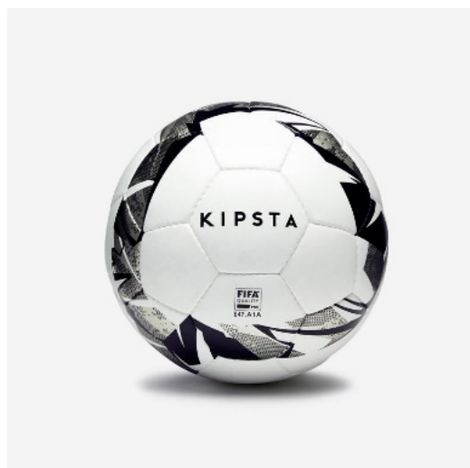
Bola de Futsal FS900 63 cm Branco/Cinza - 25,00€

Os Clubes vão receber um voucher no valor de 5% do valor investido . Este voucher pode ser utilizado em futuras compras pelos Clubes.